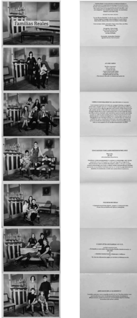
Imagen 2. Tarjetero Familias Reales, intervención del Colectivo de Familias HD para Una Ciudad Muchos Mundos, Matadero, Madrid. Coordinación Paloma Calle.