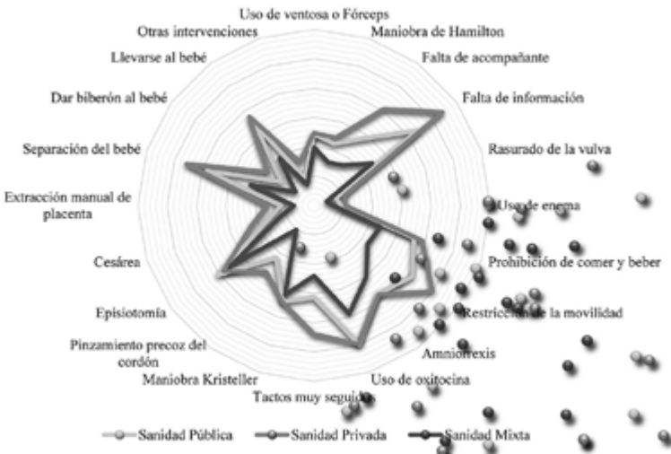
Figura 2. Intervenciones durante el parto en función del tipo de atención recibida.

A este dato, podemos añadir resultados como que el 67,9% de las mujeres pensaban que las instituciones sanitarias (Ministerio de Sanidad, Servicios de Salud, Gerencias, Consellerías) no apoyan eficazmente o promueven los derechos relacionados con el embarazo, parto, puerperio