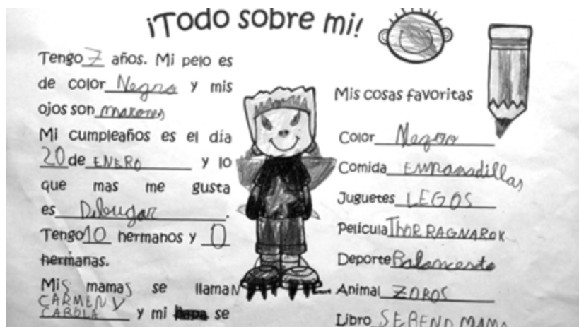
Imagen 1. Imagen ficha de presentación de mi hijo al inicio del curso 2021-2022 en su clase de 2º de primaria.

Pero, ¿de qué estoy hablando cuando me refiero a estas inercias? Para comentarlo voy a mostraros una imagen: